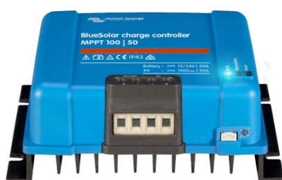
Contrôleur de charge solaire MPPT 100/50